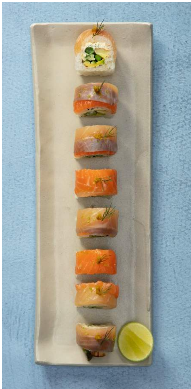
SHIME ROLL 🍣 (8u) Salmón y trucha curados, aguacate, espárragos, palmitos, pepino, queso crema con eneldo, yuzu y ralladura de limón, envuelto en hoja de papel de soya y ajonjolí. $32.900