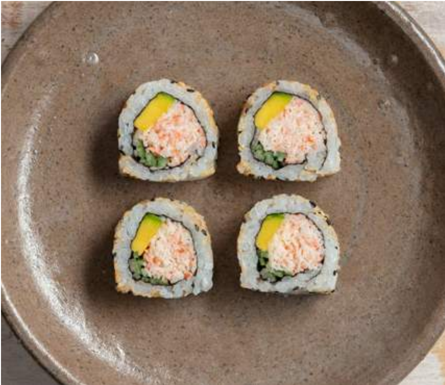
CALIFORNIA CLÁSICO (8u) Camarón, palmito de cangrejo y mayonesa, aguacate, pepino y ajonjolí. $27.900