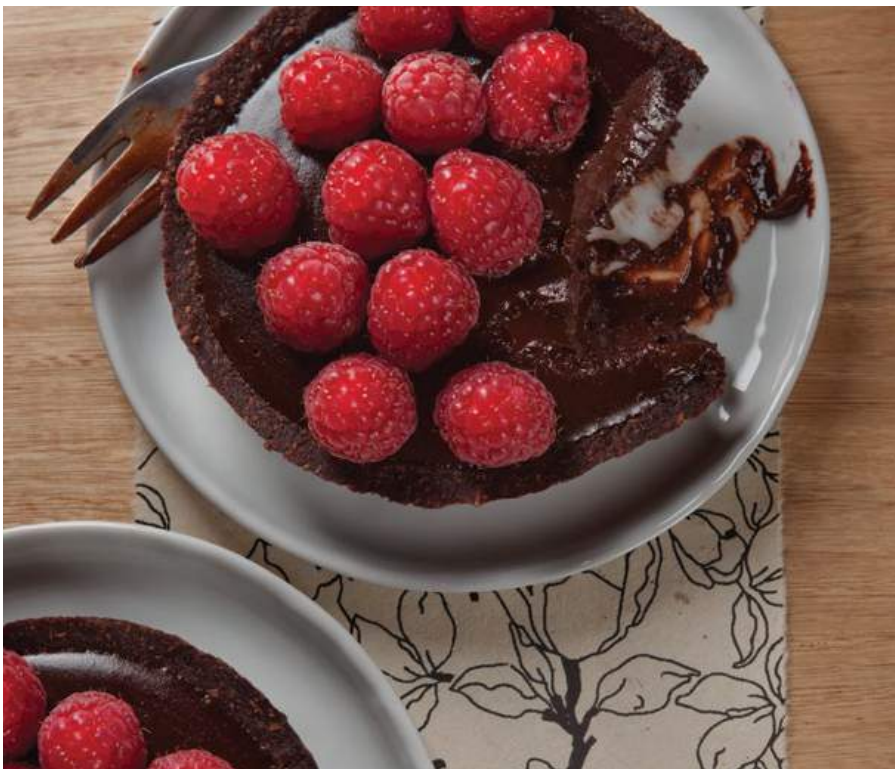
TARTELETA DE CHOCOLATE Galleta de nueces, dátiles y coco, rellena de crema de marañón, cocoa, miel y frambuesas o arándanos (según temporada). (Elaborado sin harina). $18.900