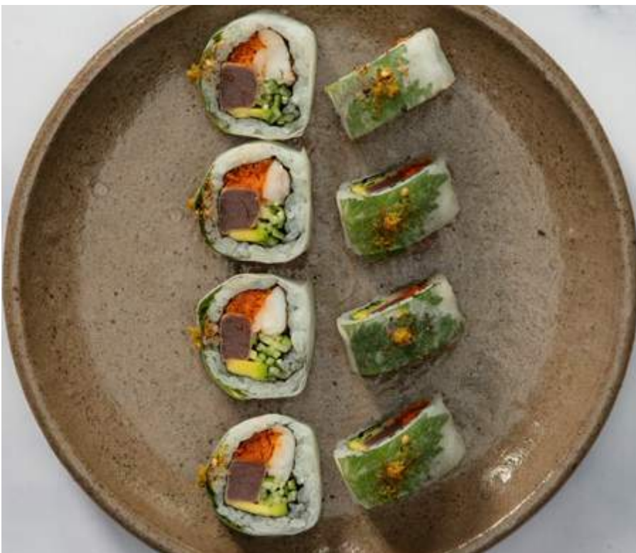
EBI MAGURO (8u) Atún o salmón, langostino, aguacate, masago, pepino, shiso y yuzu, envuelto en rábano o pepino conshichimi Wok (mezcla de ajonjolí y especias). $36.900