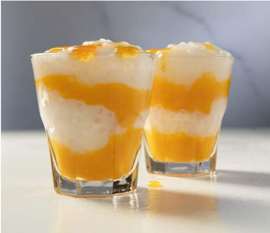
TAPIOCA CON MANGO $8.900