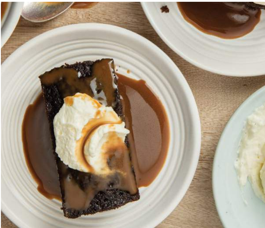
STICKY TOFFEE PUDDING Para calentar en casa $15.300