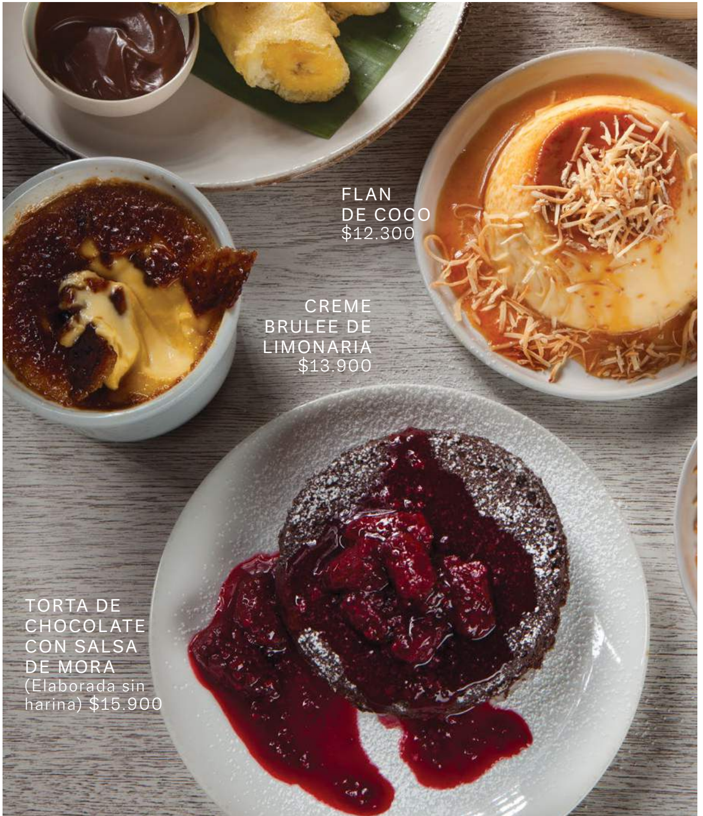
FLAN DE COCO $12.300