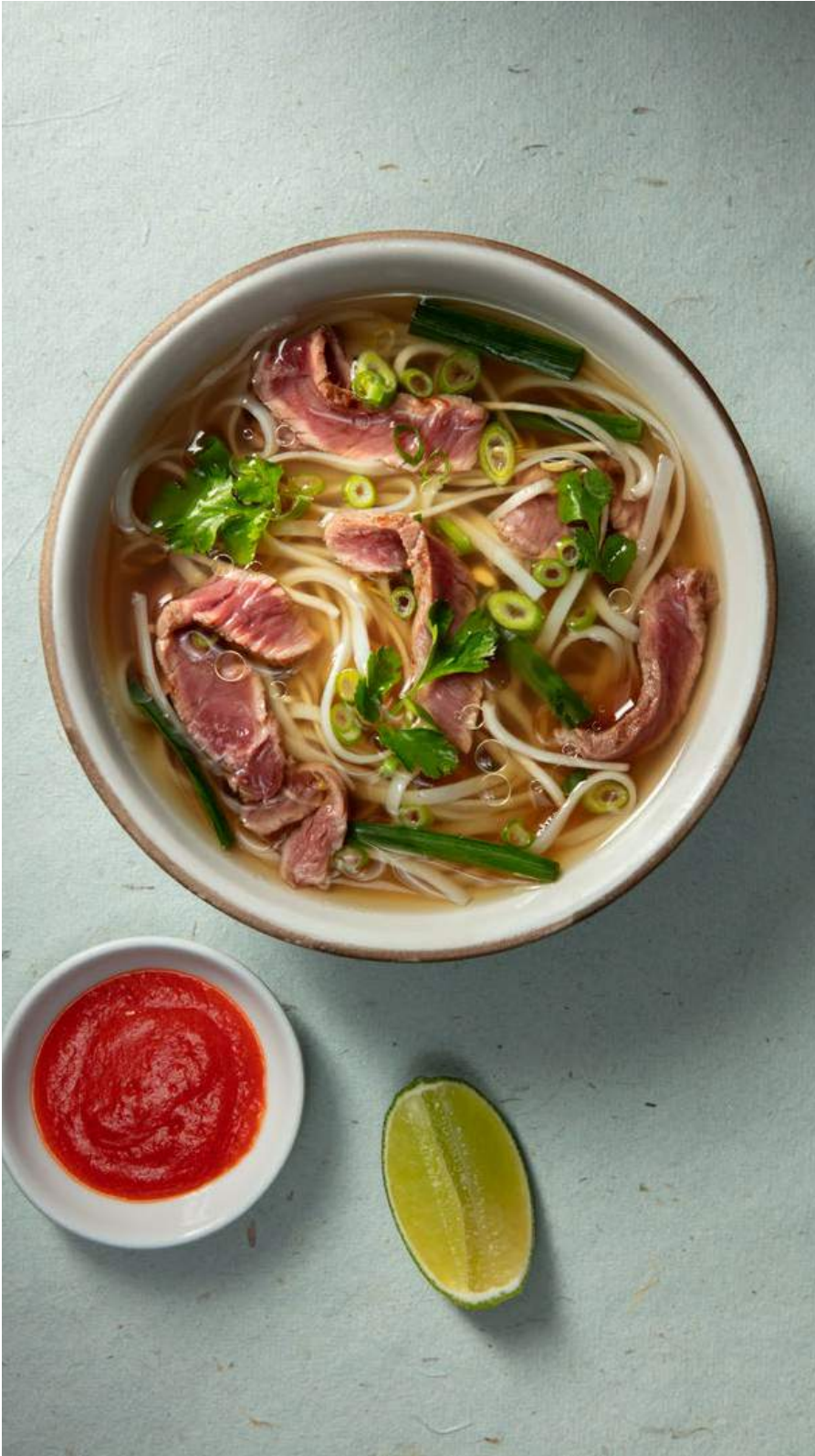
VIETNAMITA CON CADERA DE RES Consomé de pollo, con pasta de arroz, salsa de ostras, cebollín oriental y cilantro. Servida con salsa sriracha y limón. $37.900