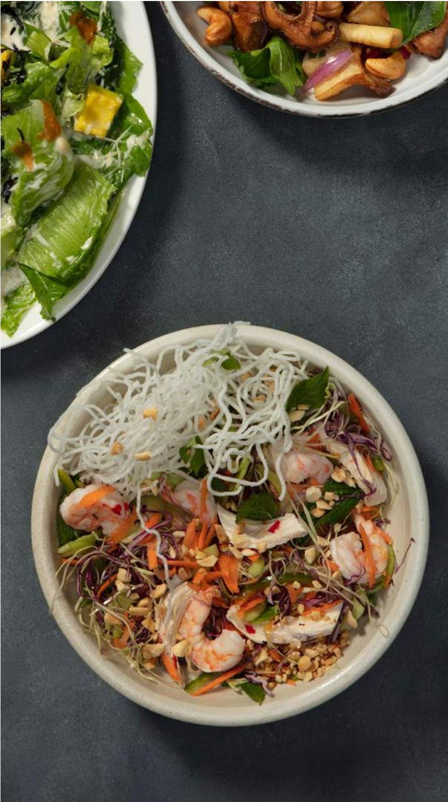
CRISPY NOODLES Camarones, pechuga de pollo, pasta vermicelli crocante, vegetales, albahaca siam, hierbabuena, maní y vinagreta vietnamita con chile y nam-pla. $36.900