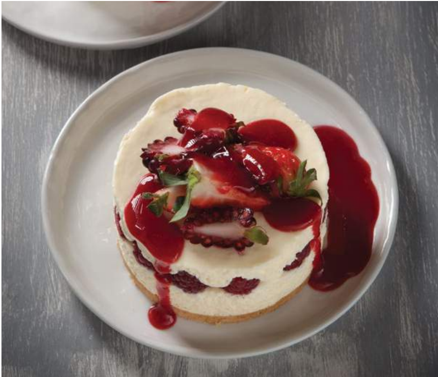
CHEESECAKE DE FRUTOS ROJOS $17.900