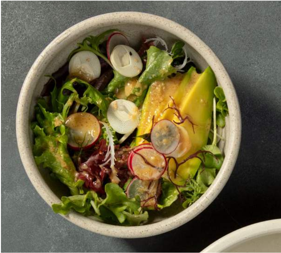
ENSALADA CON AGUACATE Y ALGAS Mezcla de lechugas orgánicas, aguacate, palmito del putumayo, ajonjolí, rábano y algas con vinagreta de jengibre. $22.900