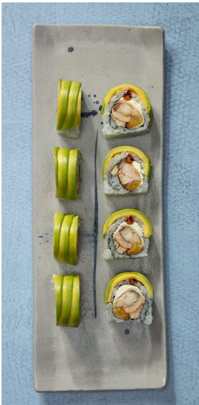
BAMBOO 🍣 (8u) Pirarucú, queso crema, mango biche y plátano, envuelto en aguacate con salsa teriyaki y ajonjolí. $37.900 SIN PIRARUCÚ $20.900