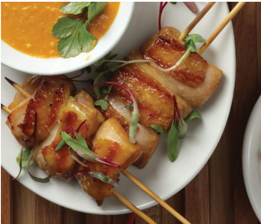
SATAY CONTRAMUSLO DE POLLO Marinados con una infusión de salsa soya y servidos con salsa a base de leche de coco y maní. $26.900