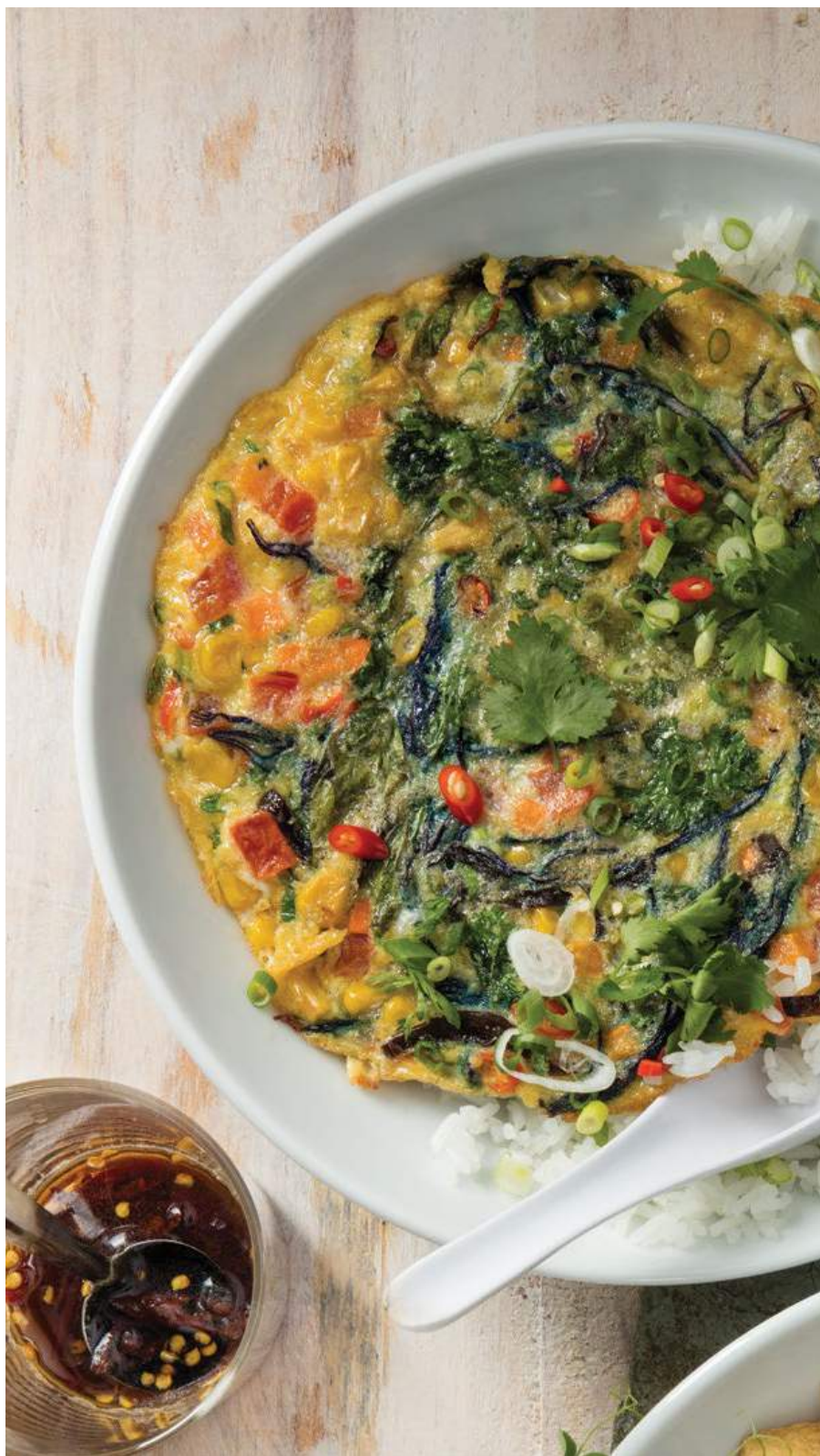
OMELETTE THAI 🔥 Tortilla de huevo con vegetales, albahaca siam, cilantro, setas (oreja de madera), chile y salsa soya. Servido sobre arroz jasmín o integral. $19.900