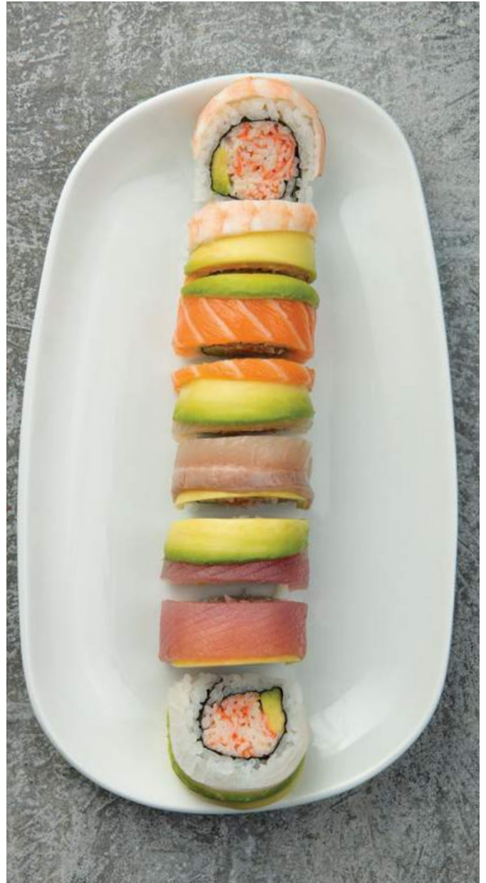
RAINBOW MAKI 🍣🍣 (8u) Camarón, palmito de cangrejo y mayonesa, envueltos en salmón, trucha, langostino, aguacate y pescado. $38.900