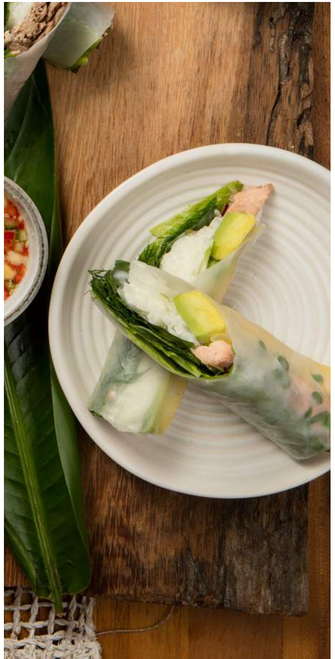
ROLLITOS DE PAPEL DE ARROZ DE TRUCHA Trucha ahumada, lechuga, jícama remoulade, mayonesa, aguacate, hierbas y germinados. Servidos con salsa vietnamita con nam-pla y maní. $28.900