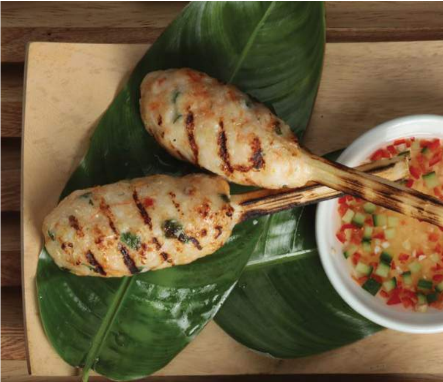
CHAO TOM Camarones aromatizados en caña de azúcar, servidos con salsa vietnamita con nam-pla y maní. $29.900