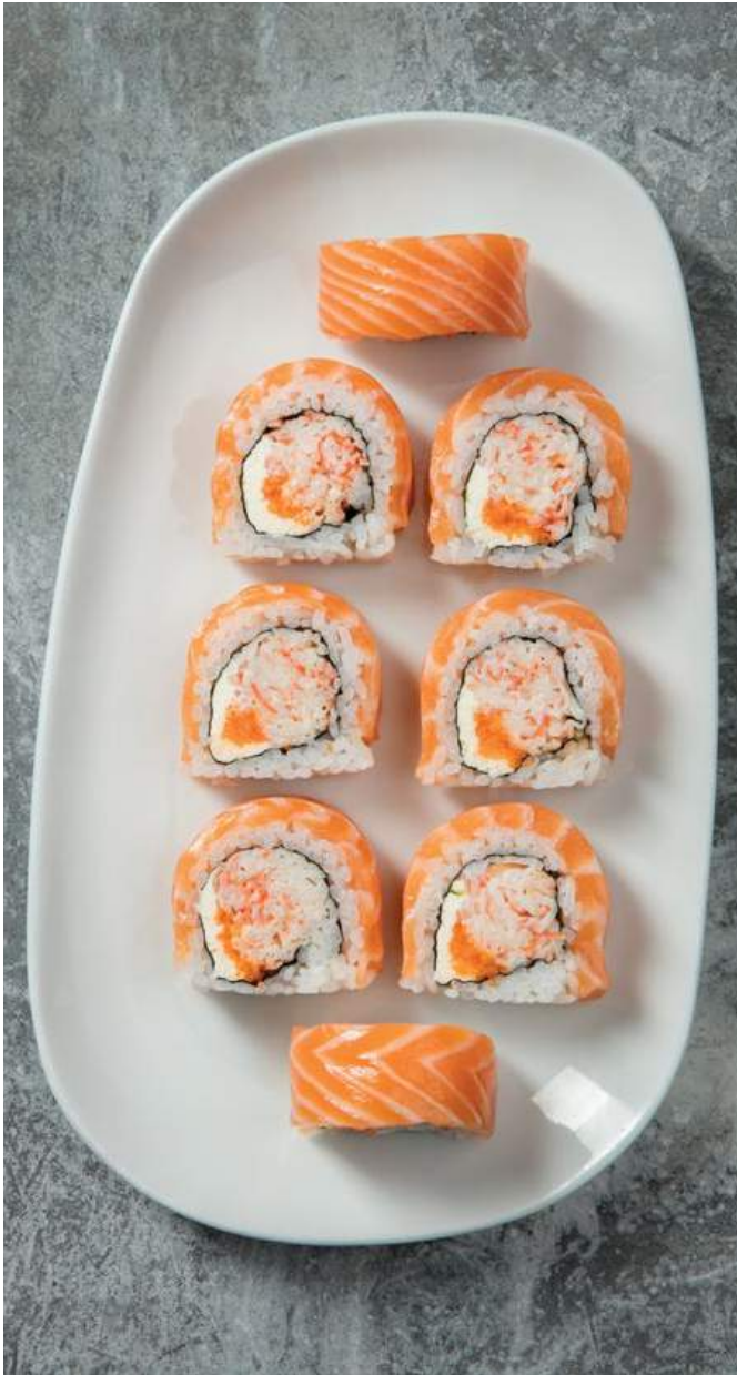
WOK MAKI SALMÓN 🍣 (8u) Palmito de cangrejo, queso crema y masago, envuelto en salmón. $39.900