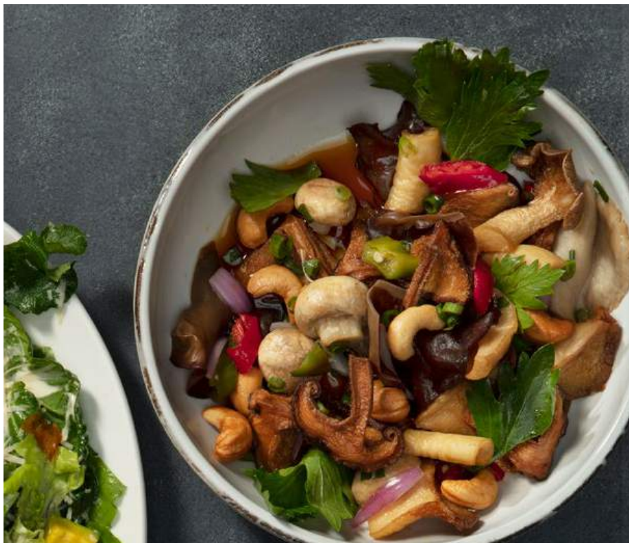
SETAS THAI 🔥 Variedad de setas, cebolla ocañera, chile, marañón, cebollín oriental, hojas de apio, ajo y vinagreta thai con salsa soya. $39.900