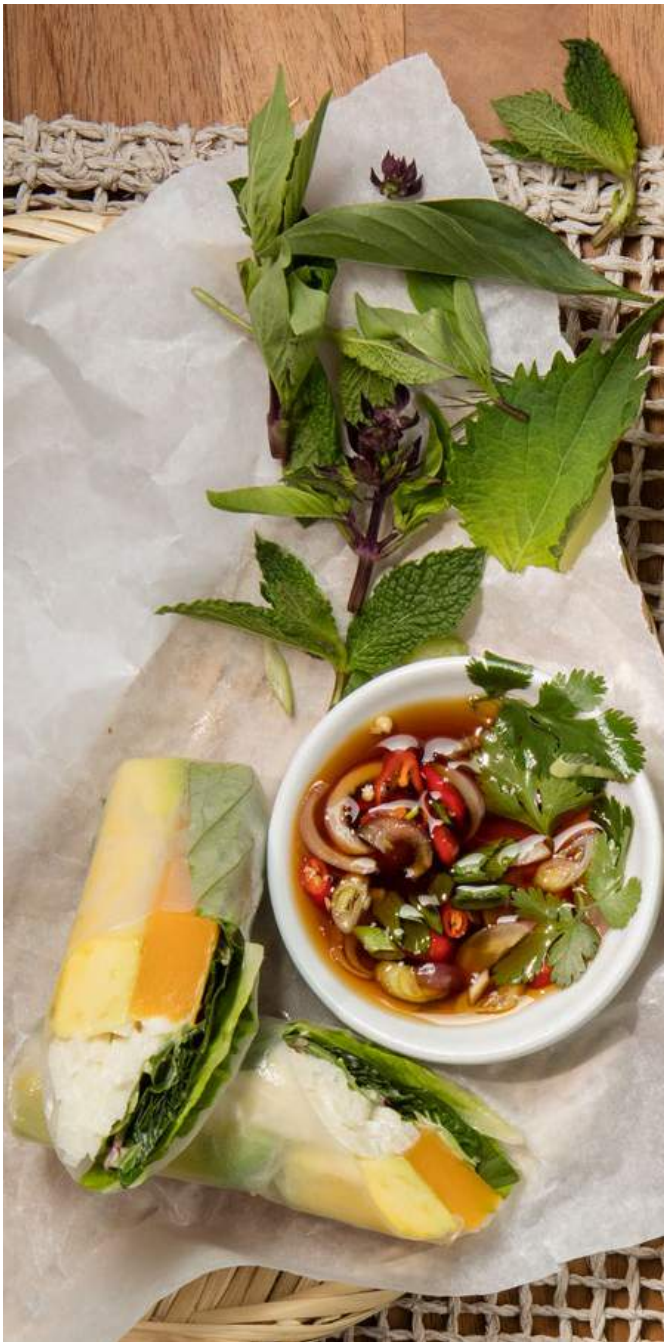
ROLLITOS DE PAPEL DE ARROZ DE VEGETALES Zapallo, lechuga, aguacate, jícama remoulade, mayonesa, germinados y salsa vietnamita a base de soya (sin nam-pla). $20.700